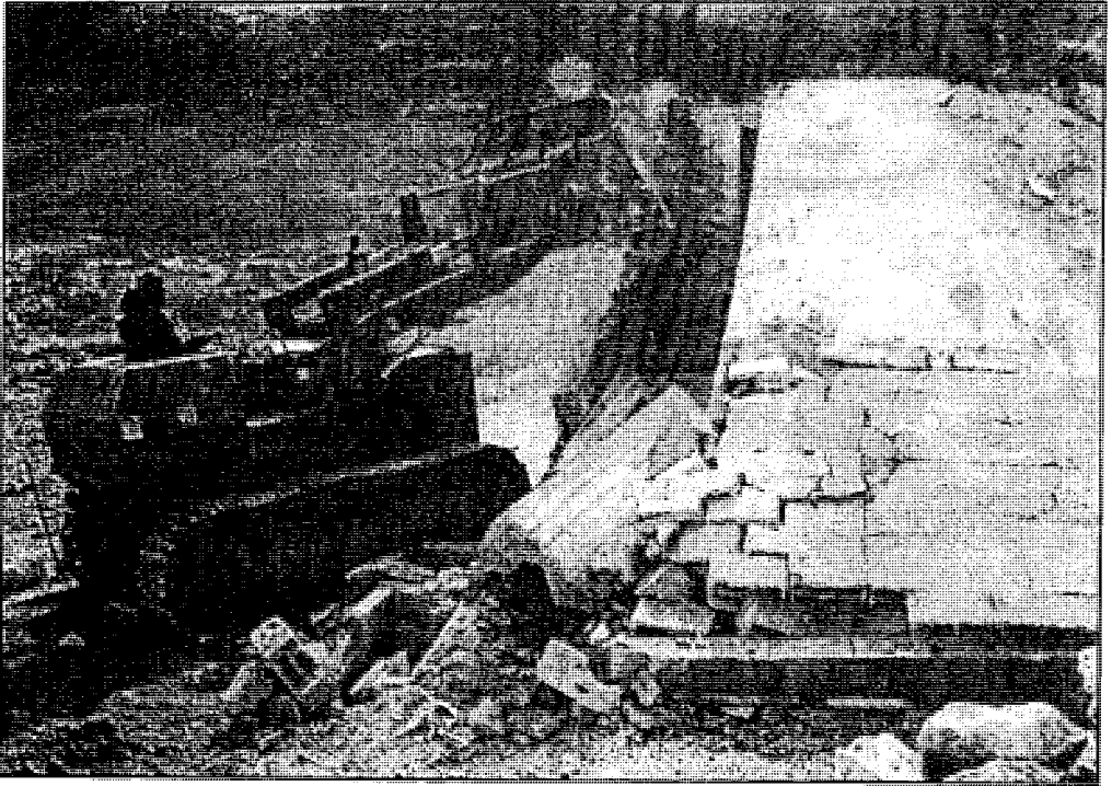
بلدوزات إسرائيل تهدم البيوت العربية لتبنى مستوطناتها الشيطانية في القدس